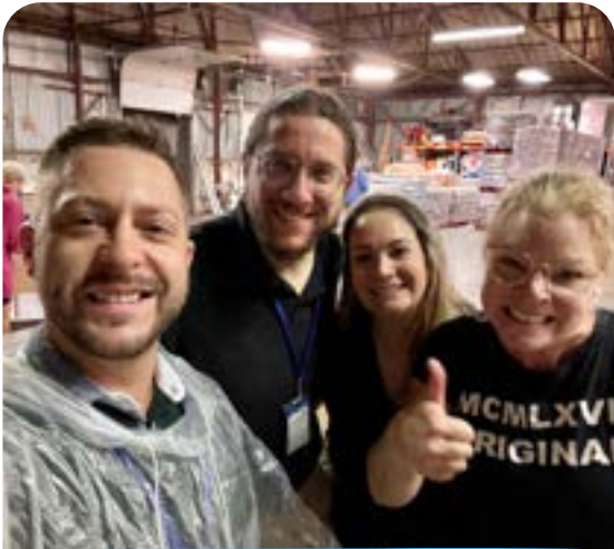
L'équipe qui récupère un don de livre de First Book Canada et Moisson Montréal