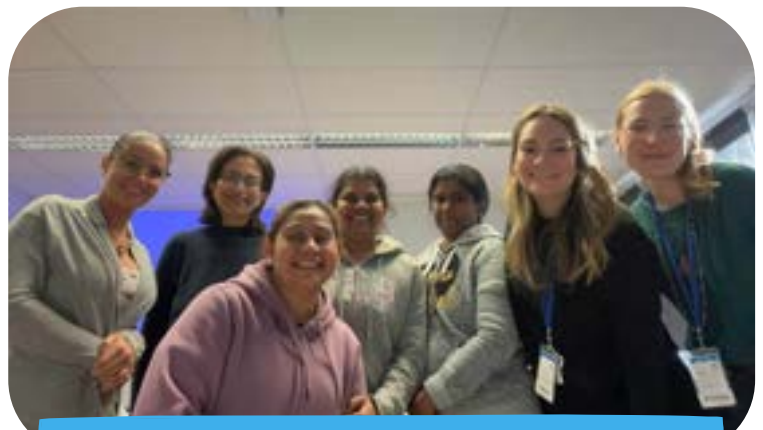
minibiblioPLUS à Mountain Sights pour animer un atelier pour éducatrices