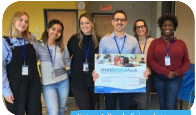
Notre atelier de Salon du Livre au Centre communautaire St-Raymond